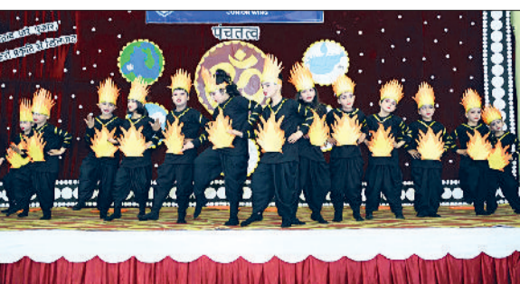
जीद। कार्यक्रम की प्रस्तुति देते हुए बच्चे।