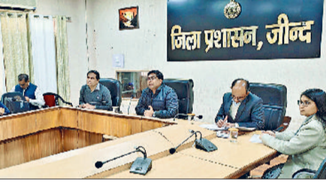
जीद। वीसी में भाग लेते हुए डीसी।