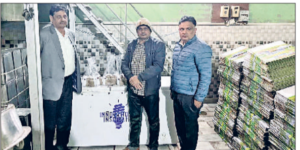
जींद। जांच करते हुए टीम।

खांसी, जुखाम है। वहीं पिछले एक सप्ताह से अधिकतम और न्यूनतम तापमान में उतार चढ़ाव बना हुआ है। वीरवार को अधिकतम तापमान 19 डिग्री तो न्यूनतम तापमान 8 डिग्री रह रहा है। जिसके चलते इस समय सर्दी, जुखाम, बुखार के मरीजों की संख्या बढ़ गई है। जिला मुख्यालय स्थित नागरिक अस्पताल की बात की जाए तो यहां प्रतिदिन 100 से 150 मरीज ऐसे पहुंच रहे हैं जिन्हें या तो बुखार है या फिर सर्दी या खांसी है।