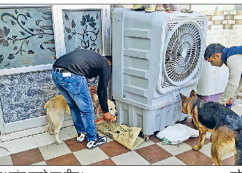
जीद। जांच करते हुए टीम।