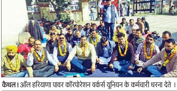
कैथल। ऑल हरियाणा पावर कॉरपोरेशन वर्कर्स यूनिन के कर्मचारी घरना देते।