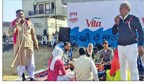
जुलाना। जुलाना में सांग का मंचन करते कलाकार।