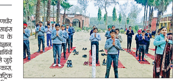
जुलाना। रामकली गांव के सूर्य नमस्कार करते छात्र।