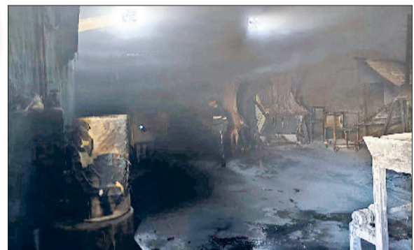
जींद। आग से फैक्टरी में जला सामान।

सफ़ीदों के गैस एजेंसी रोड पर वीरवार दोपहर बाद पट्टी फैक्टरी में संदिग्ध हालात में आग लग गई। जिसमें तीन मजदूर आंशिक तौर पर झुलसे गए और अंदर रखा माल तथा मशीनें जल गईं। झुलसे मजदूरों को सफ़ीदों के नागरिक अस्पताल में भर्ती करवाया गया है। फायर ब्रिगेड की गाड़ी ने मौके पर पहुंच कर आग पर काबू पाया। सफ़ीदों के गैस एजेंसी रोड पर पट्टी फैक्टरी में वीरवार दोपहर बाद अचानक आग भड़क उठी। घटना के दौरान फैक्टरी में तीन सौ मजदूर कार्य कर रहे थे। आग इतनी जल्दी फैली कि मजदूरों को मुश्किल से सभलने की मौका मिला। वहां मजदूरों ने आग पर काबू पाने की कोशिश भी की लेकिन आग फैलती चली गई। आग बुझाने के