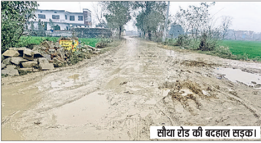
सौथा रोड की बदहाल सड़क।

सौथा रोड पर रहने वाले लोग विशेषकर बरसात के मौसम में भारी संकट में हैं। पानी की निकासी की कोई ठोस व्यवस्था नहीं होने के कारण लोगों को झाड़ू और बाल्टी लेकर अपने घरों के सामने से पानी