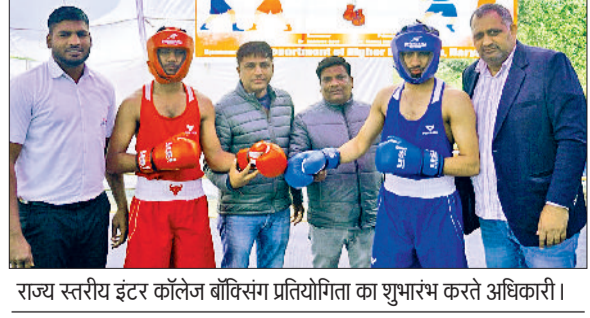
राज्य स्तरीय इंटर कॉलेज बाक्सिंग प्रतियोगिता का शुभारंभ करते अधिकारी।