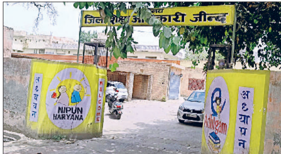
जीद। जिला शिक्षा अधिकारी कार्यालय।

मान्यता प्राप्त विद्यालयों में चिराग स्कीम के तहत छठी से 12वीं कक्षा के विद्यार्थियों के दाखिले को लेकर शेड्यूल जारी हुआ है। इसके लिए विद्यालय शिक्षा निदेशालय ने प्रदेश के सभी जिला शिक्षा अधिकारी व जिला मौलिक शिक्षा अधिकारियों के नाम पत्र जारी किया है। जारी पत्र के अनुसार मान्यता प्राप्त निजी स्कूल चिराग स्कीम के अंतर्गत विद्यार्थियों के दाखिले करने बारे अपनी सहमति विभाग की वेबसाइट पर 29 जनवरी से 15 फरवरी तक दर्ज करवा सकते हैं। विद्यालयों की कक्षा अनुसार घोषित सीटों का विवरण विभाग द्वारा विभागीय वेबसाइट/पोर्टल पर दर्शाया जाएगा व संबंधित विद्यालय 10 मार्च से नोटिस बोर्ड पर खाली सीटों की जानकारी प्रदर्शित करेगा। अभिभावक व छात्र सहमत मान्यता