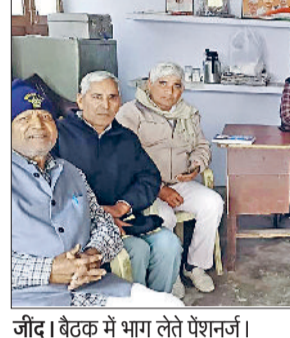
जीद। बैठक में भाग लेते पेंशनर्स।

जुलाना कस्बे के मेन बाजार में निकासी व्यवस्था पूरी तरह से ठप पड़ी हुई है जिसके चलते दुकानदारों और प्राहकों को भारी परेशानियों का सामना करना पड़ रहा है। बाजार में पानी की निकासी का कोई पुख्ता इंतजाम न होने के कारण हल्की बारिश या पानी भरने की स्थिति में दुकानों के आगे जलभराव हो जाता है। इससे न केवल आवागमन प्रभावित होता है बल्कि दुकानदारों का व्यापार भी बुरी तरह प्रभावित हो रहा है। दुकानदारों का कहना है कि उन्होंने इस समस्या को लेकर कई बार बीडीपीओ कार्यालय में लिखित व मौखिक शिकायतें दी हैं लेकिन