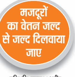
हरिभूमि न्यूज ॥ जीद