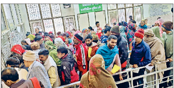
जींद। नागरिक अस्पताल में दवा लेने के लिए लगी लंबी लाइन।

जुखाम, खांसी के मरीजों को ठीक होने में ही एक सप्ताह का समय लग रहा है। ऐसे में चिकित्सकों की सलाह है कि मौसम को देखते हुए