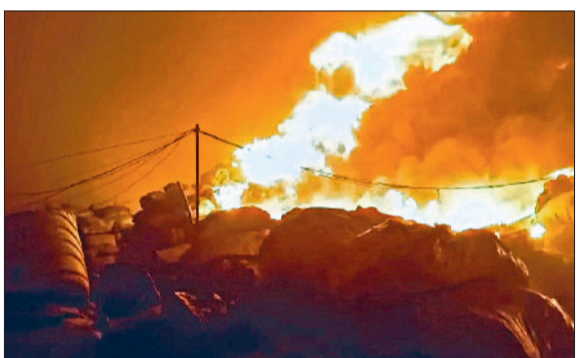
कलायत। फैलरम के पास कबाड़ के गोदाम में लगी आग।