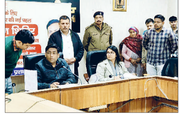
जीद। समाधान शिविर में शिकायतें सुनते डीसी।