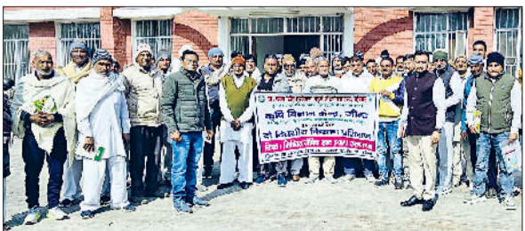
जीद। ट्रेनिंग में शामिल किसान।

चौधरी चरण सिंह हरियाणा कृषि विश्वविद्यालय हिसार के कृषि विज्ञान केंद्र (केवीके) जीद द्वारा किसानों को जैविक खेती के आधुनिक तरीकों से अवगत कराने के लिए दो दिवसीय प्रशिक्षण कार्यक्रम का आयोजन किया गया। इस प्रशिक्षण का मुख्य विषय जैविक खाद और तरल जैविक खाद का उपयोग एवं महत्व था। कार्यक्रम में जिले के विभिन्न गांवों से आए किसानों ने बढ़चढ़कर हिस्सा लिया। प्रशिक्षण कार्यक्रम के मुख्य समन्वयक और मृदा